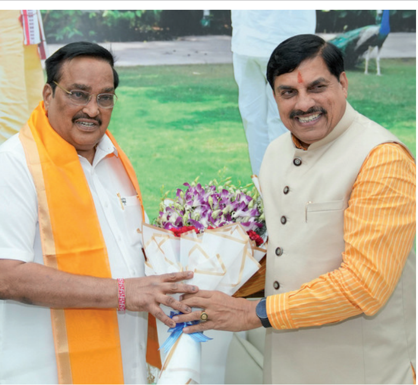
मुख्यमंत्री डॉ. मोहन यादव ने नई दिल्ली में केंद्रीय जल शक्ति मंत्री श्री सी.आर.पाटील से उनके निवास स्थान पर सौजन्य भेंट की।

शिवराज सिंह चौहान ने एक वीडियो भी साझा किया। इसमें उन्होंने कहा कि दुनिया प्रधानमंत्री मोदी को एक वैश्विक नेता के रूप में देखती है, लेकिन उन्होंने उन्हें एक साधक और कर्मयोगी के रूप में बहुत करीब से देखा है। उन्होंने कहा कि वे देर रात तक फाइलों पर काम करने के बाद भी आगली सुबह उसी ऊर्जा और संकल्प के साथ देश सेवा में जुट जाते हैं। उन्होंने पुस्तक में उल्लेख किया है कि कैसे प्रधानमंत्री मोदी का हृदय सदैव किसानों, माताओं, बहनों और साधारण कार्यकर्ताओं के लिए धड़कता है।