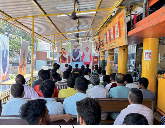
साधना एक्सप्रेस भोपाल

प्रधानमंत्री मोदी के मन की बात प्रसारण को युवा साथियों के साथ सुना