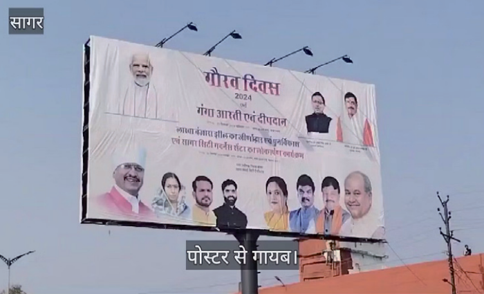
पोस्टर से गायब।